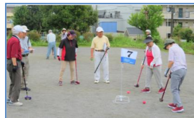
東部地区 河原塚ことぶき会