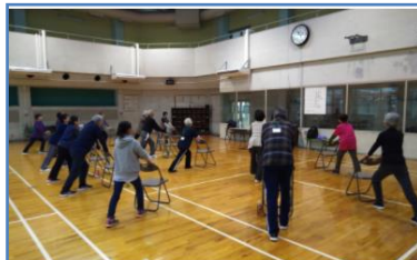
矢切地区 クロダマハウス